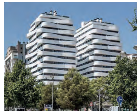
Promoción Salер Homes en Valencia.

Los servicios prestados por Acerta en la fase previa a la construcción fueron desde la revisión del proyecto de ejecución, el análisis de coherencia con el libro blanco y documentación comercial hasta la licitación